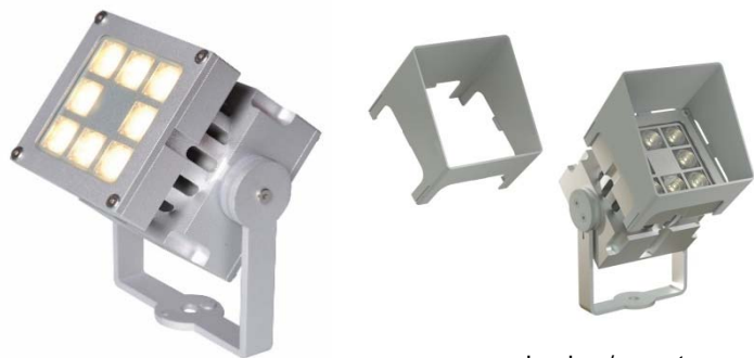
revo basic c/ snoot